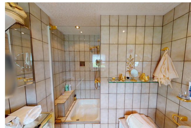
WHG Nr. 2 Bad 1