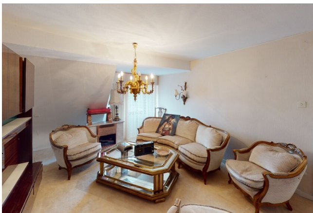
WHG Nr. 3 Wohnbereich