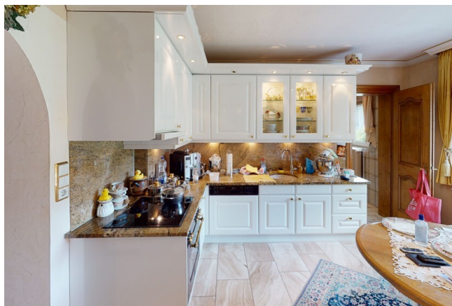
WHG Nr. 2 Küche 1