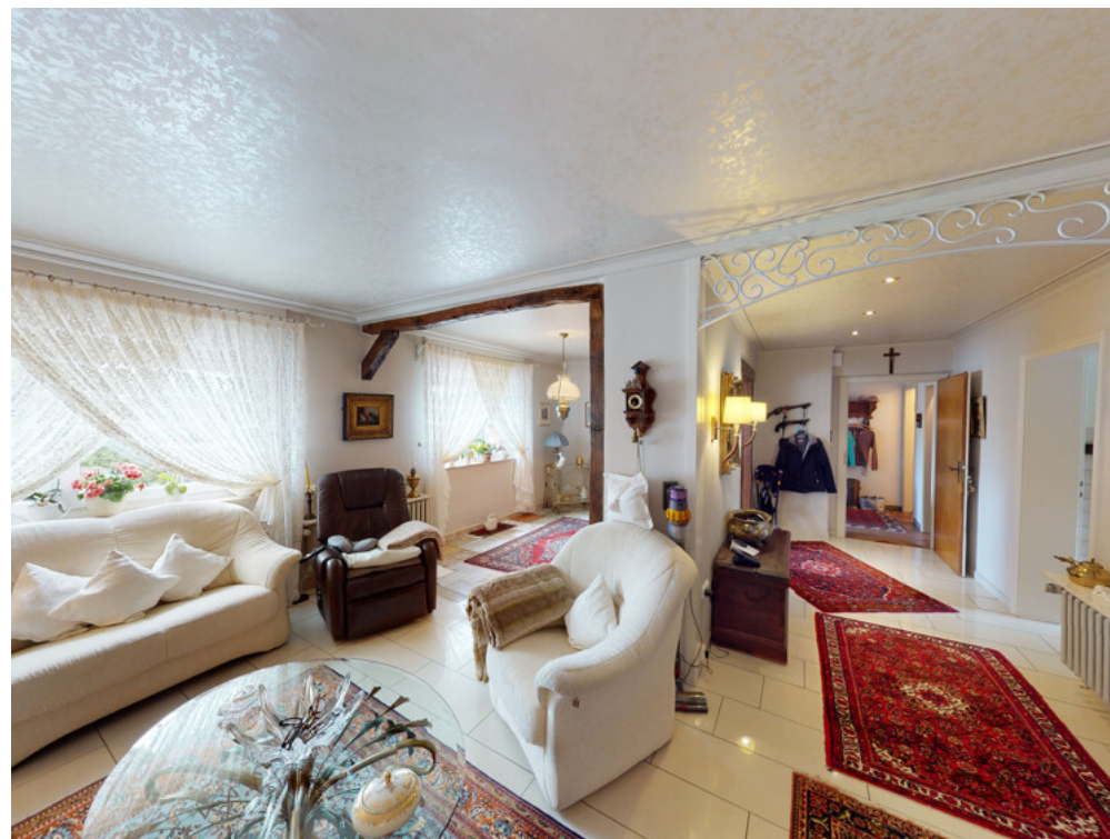
WHG Nr. 1 Wohnbereich