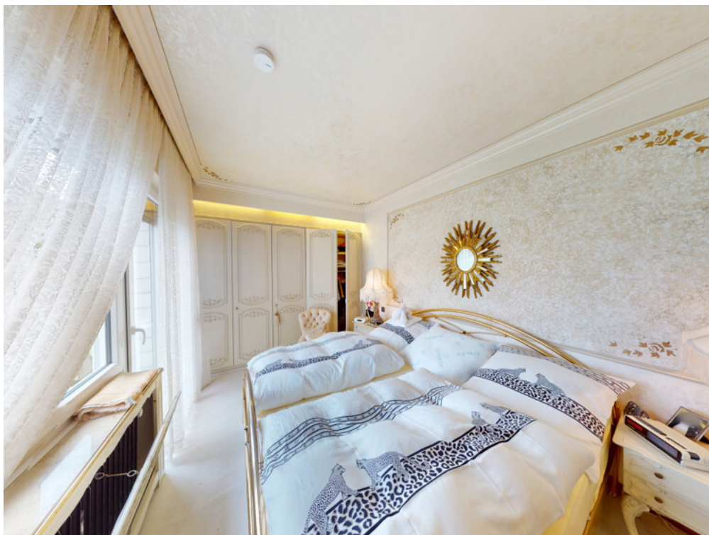
WHG Nr. 2 Schlafzimmer