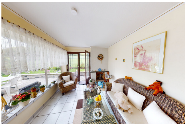
WHG Nr. 1 Wintergarten