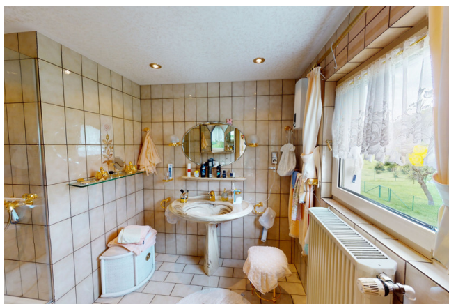
WHG Nr. 2 Bad