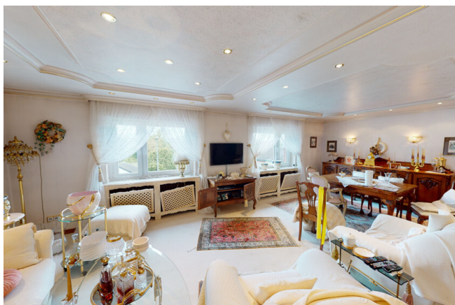
WHG Nr. 2 Wohn Essbereich 2