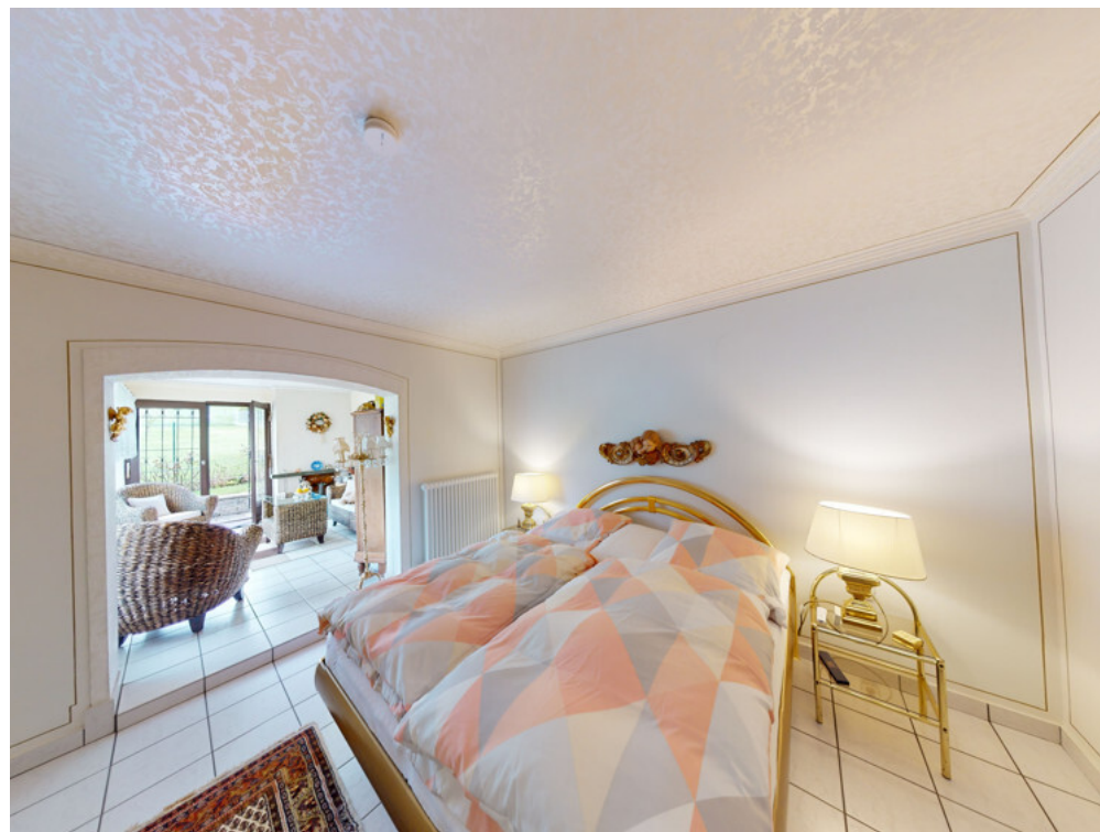
WHG Nr. 1 Schlafzimmer