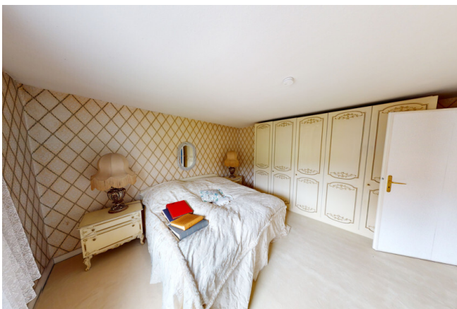
WHG Nr. 3 Schlafzimmer