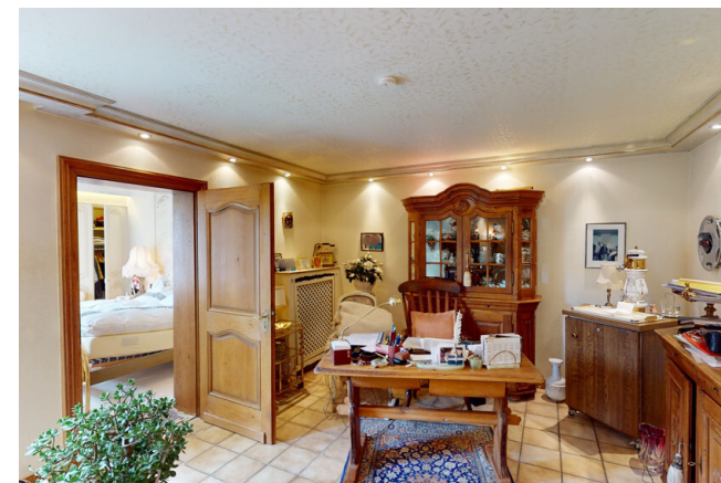
WHG Nr. 2 Büro