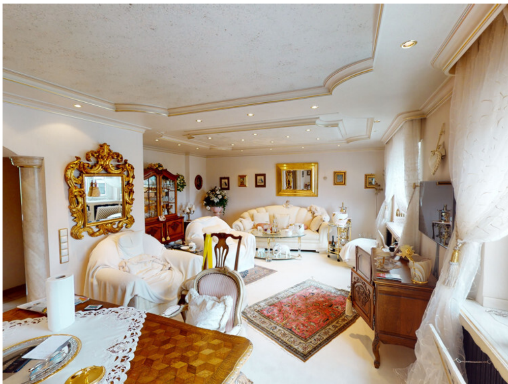
WHG Nr. 2 Wohn Essbereich